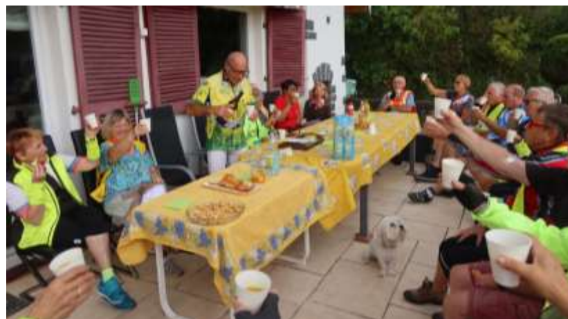
12 octobre : cyclistes