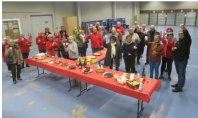
15 janvier : gym, encadrants et marcheurs du samedi