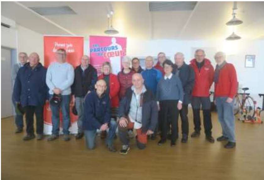
Préparatifs du samedi après-midi

Partenariat : médecin et infirmières de l'hôpital, étudiants de l'IFSI, l'Engrenage