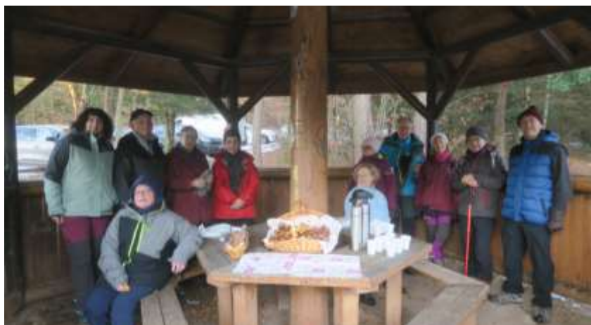
12 janvier : marche du vendredi