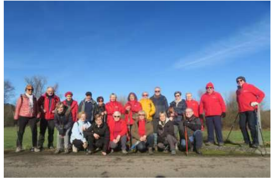
28-1 - Etival