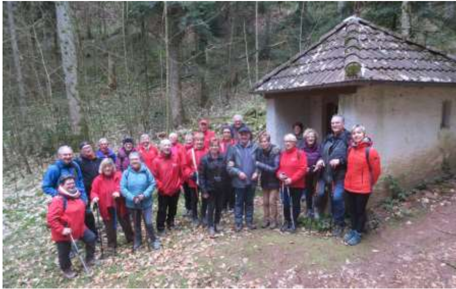
3-3 - Provençères