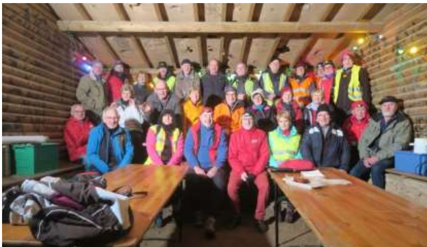
18 décembre : marche nordique