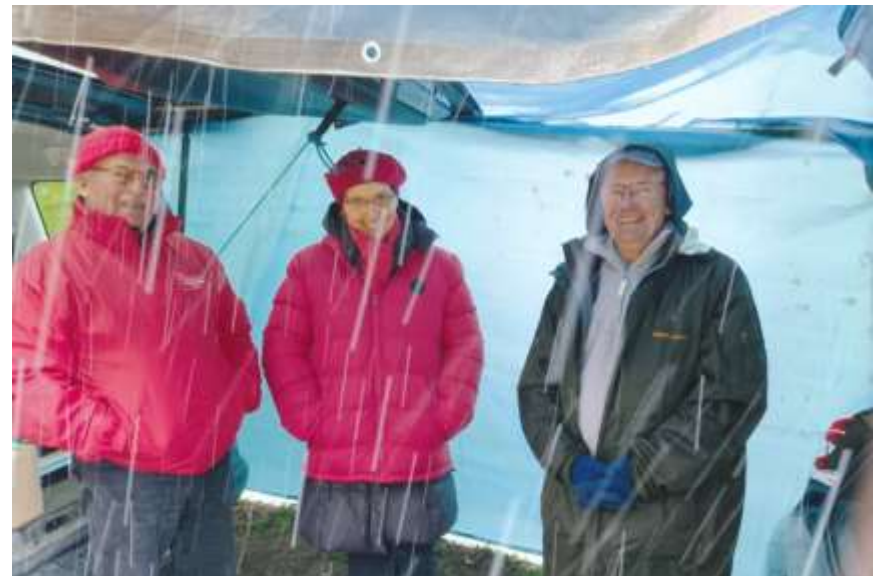
Poste de contrôle le dimanche matin