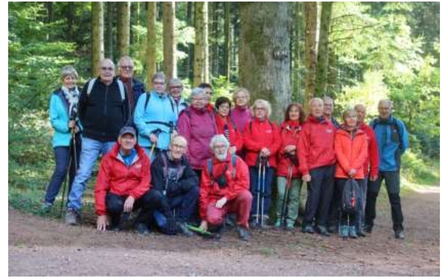
15-10 - Kemberg