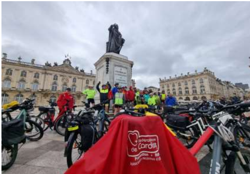
19 juin à Nancy avec les clubs de Lunéville et Nancy