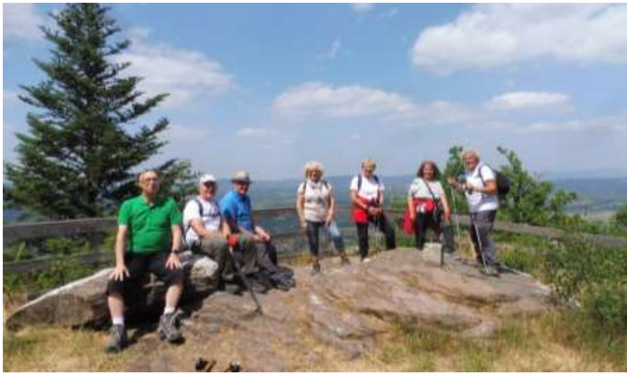
2-7 - Roches des Hauts Champs