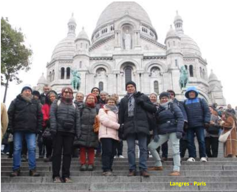
Langres - Paris