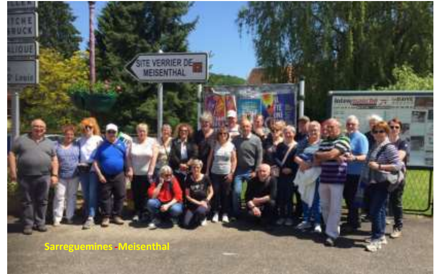
Sarreguemines - Meisenthal