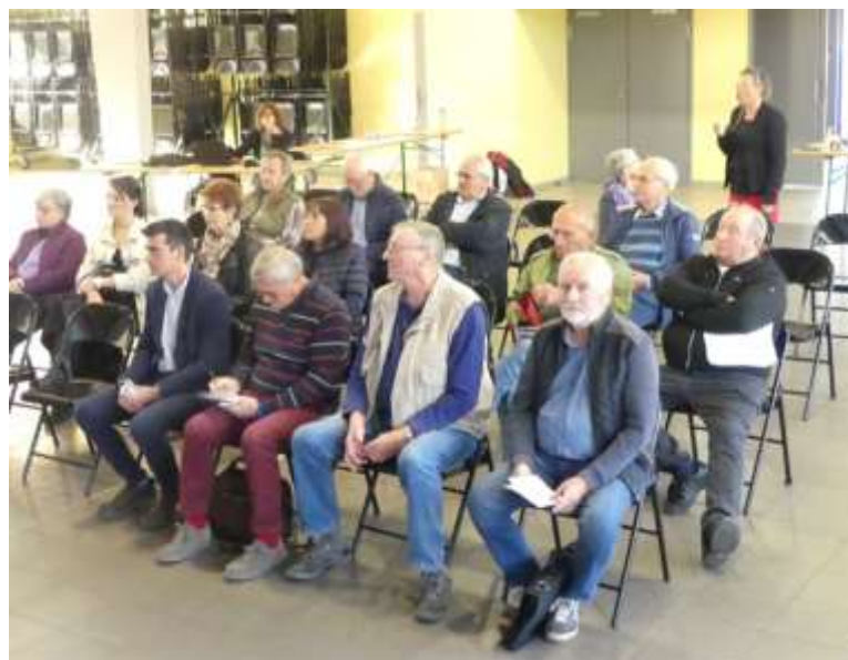
St-Dié : réunion d'élus de 16 communes lors de la Journée mondiale de l'arrêt cardiaque