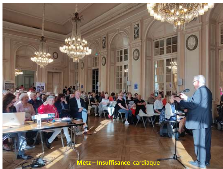
Metz - Insuffisance cardiaque