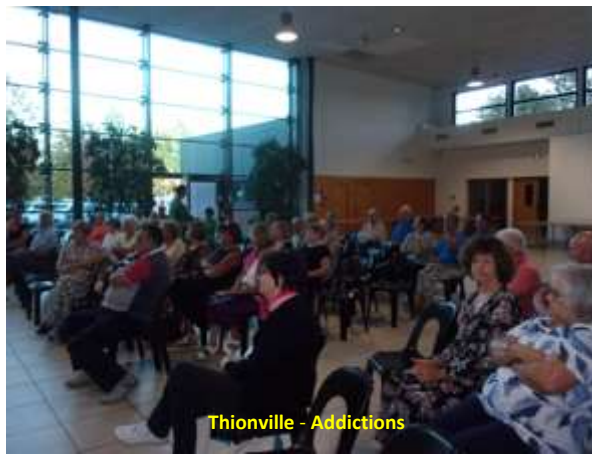
Thionville - Addictions