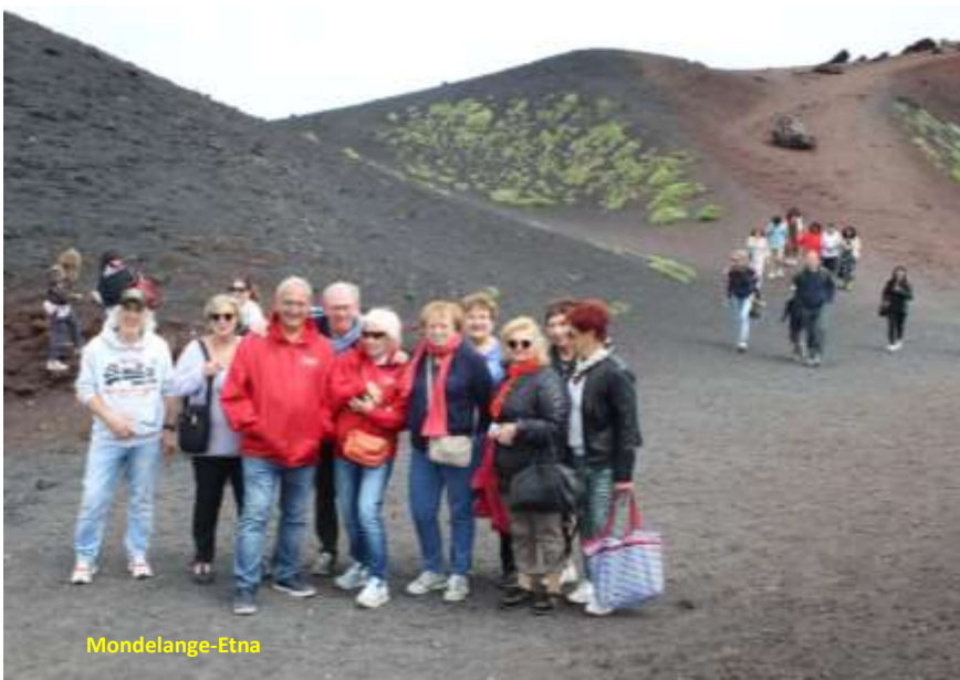
Mondelange - Etna