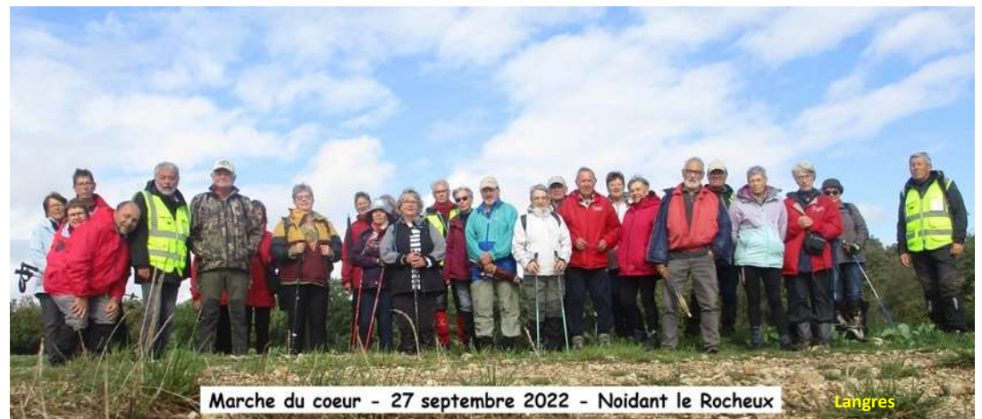
Marche du coeur - 27 septembre 2022 - Noidant le Rocheux