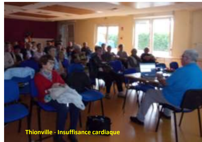
Thionville - Insuffisance cardiaque