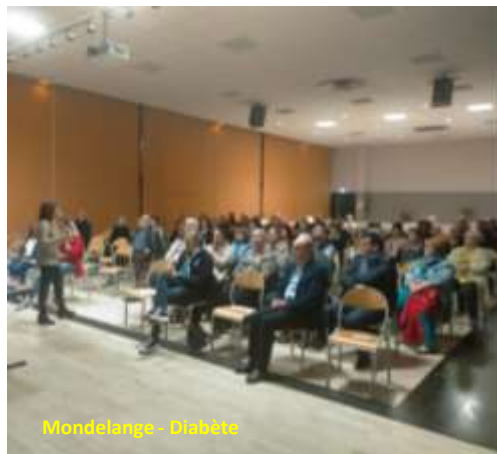
Mondelange - Diabète