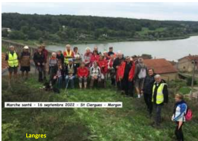
Marche santé - 16 septembre 2022 - St Ciergues - Magon