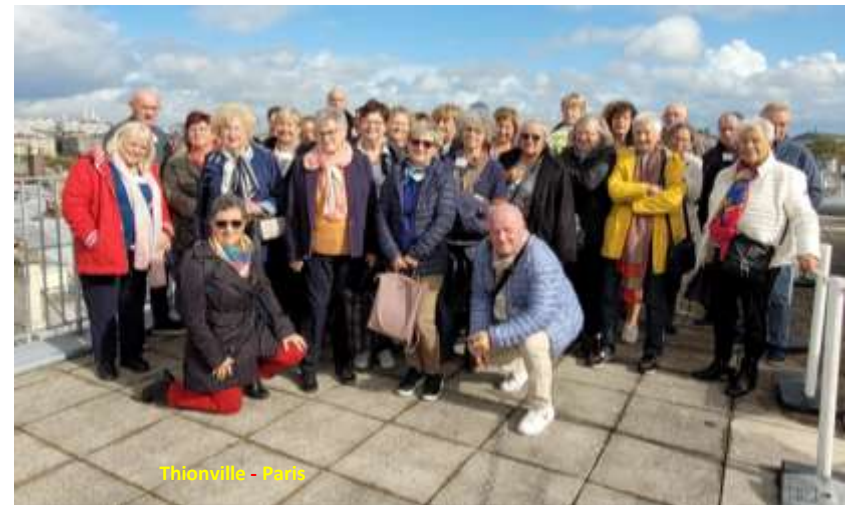
Thionville - Paris