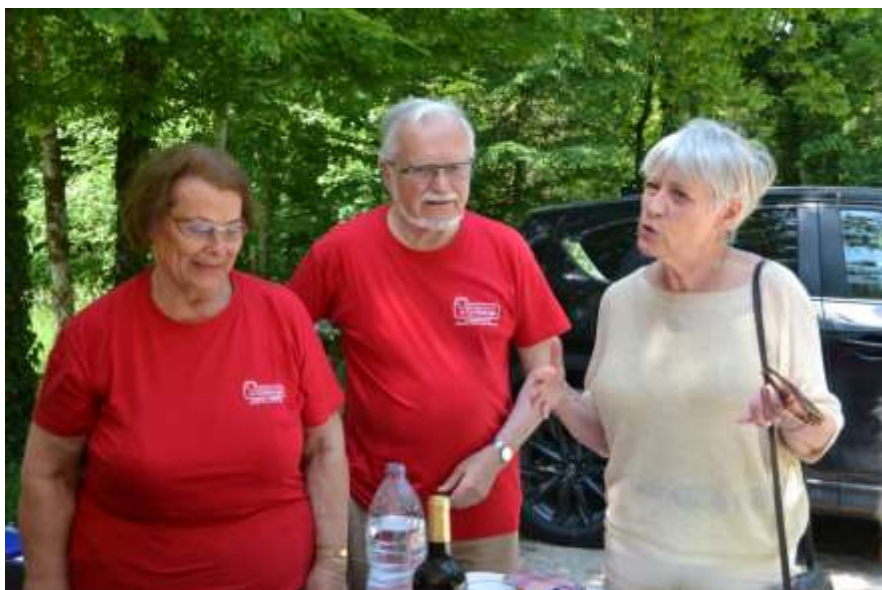
Chaumont : visite de la maire lors du Parcours du Cœur