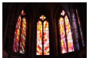
Vitreaux de la cathédrale