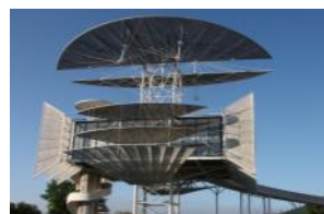
Tour de la Liberté (1989)