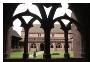
Eglise (XIIe) et cloître (15-16e)