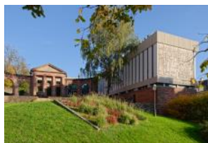
Musée Pierre Noël