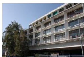
Usine Le Corbusier