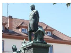
Statue de Jules Ferry