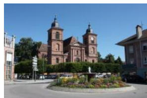
La cathédrale (XII-XVIIIe)